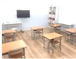
ミニ館 1 階