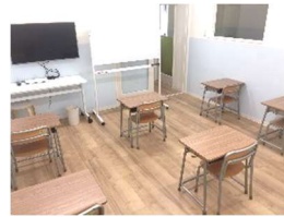
ミニ館 2 階